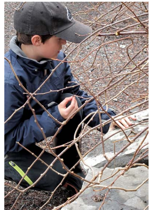
Chasse aux insectes à Québec, 24 heures de science 2011