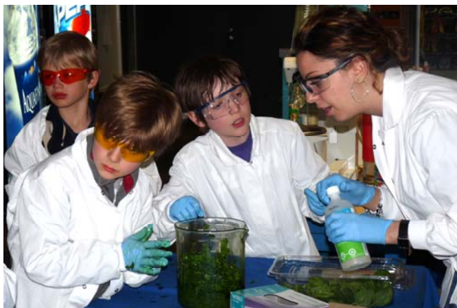
Activité du 24 heures de science, édition 2011, à l'Université de Montréal