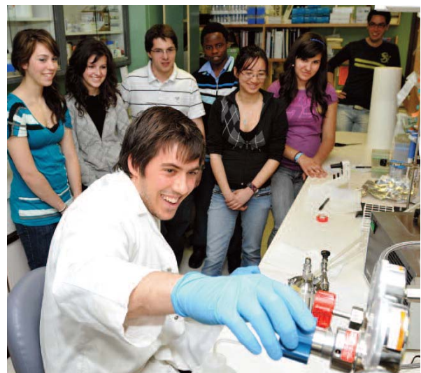
Activité du 24 heures de science édition 2009 à l'Université de Sherbrooke

Cette thématique sera au cœur de l'actualité puisque 2010 a été désignée Année internationale de la biodiversité par les Nations Unies. Les organismes participants sont invités à s'inspirer de ce thème lors de la préparation des activités, mais s'en s'y tenir obligatoirement.